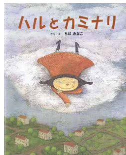
ハルとカミナリ ちば みなこ／さく・え BL出版 (国内絵本／062)

カミナリが鳴る日、ハルは、カミナリの親子ゴロリとピカリから、雲の上で開催される「へそまつり」に招待されました。雲の上には、カミナリさまの村や雲の畑があり、そこで採れる「へその実」を使ったご馳走が用意されていて……。ハルは無事に家に帰ることが出来るのでしょうか?独特な雰囲気のある不思議なお話です。