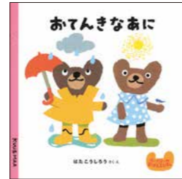
おてんきなあに はた こうしろう／さく・え ポプラ社 (あかちゃん絵本／057)

「あしたはなにしておそぶ?」「あしたのおてんきはなんだろう」夜眠る前、双子のこぐまが話しています。晴れたら、川遊びやお花畑に行こう!風が吹いたら凧を飛ばし、ヨットにも乗りたいな。雨が降ったら、カエルの歌を聴きに行こう。雪が降ったら雪遊び。いろいろな天気のお楽しみ方が描かれた絵本です。