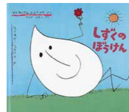
しずくのぼうけん マリア・テルコフスカ／さく うちだりさこ／やく ポフダン・ブテンコ／え 福音館書店 (海外絵本／063)

バケツから水が一滴飛び出して、しずくの長い冒険が始まります。始めに、汚れた体をきれいにしようとクリーニング屋に行きました。その後、太陽に照らされて蒸発し、雲まで昇ったと思ったら、雨になって地面へ逆戻り。さらに今度は、岩の割れ目にはまってしまい……。水が蒸発して雨になる過程も学ぶことができます。