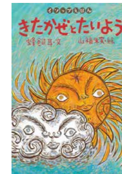
きたかぜとたいよう 蜂飼 耳／文 山福 朱実／絵 岩崎書店 (海外のむかしばなし絵本／061)

空の上で遊んでいた北風と太陽は、どちらが先に村人の服をぬがせられるか、勝負をすることになりました。力を込めて強い風を吹かせる北風に対し「僕ならそんな乱暴なことはしませんよ」と、余裕をみせる太陽。さて、どちらが勝つのでしょうか。有名なイソップ童話を、リズムカルな文とダイナミックな絵で表現しています。