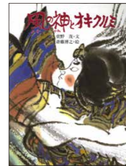
風の神とオキクルミ アイヌの民話 萱野 茂／文 斎藤 博之／絵 小峰書店 (国内のむかしばなし絵本／060)

風の女神ピカタカムイは、退屈のぎに人間たちを驚かせてやろうと風の舞で嵐をおこし、アイヌの村をめちゃくちゃにしてしまいます。それに怒った村の若者オキクルミは……。アイヌの神は時折人間として生活し、人々を導き、神を指導します。どのようにピカタカムイを懲らしめるのか、強さと優しさを持ち合わせたオキクルミの行動に注目です。