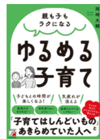
岡崎 大輔 / 著 明日香出版社 (美容・健康 / 139)