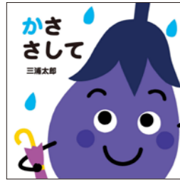
かささして 三浦 太郎／さく・え 童心社 (あかちゃん絵本／057)

赤、緑、紫、黄色。カラフルでかわいらしい野菜たち。雨粒とのコントラストがとてもきれいで思わず目を引きます。そして、雨が降ってきたときに野菜たちが口にする「れれれれれ」「げげげげ」「もももも」といった表現からは、雨の日をなんだか嬉しそうに楽しむ様子が伝わってきます。