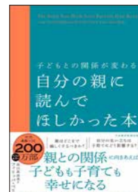
フィリップ・ベリー / 著 高山 真由美 / 訳 日経BP日本経済新聞出版 (社会 / 016)

勉強をしない子に「勉強をしない」と叱るよりも「勉強の楽しさを教える」ことや、マイペースな子に「急ぎなさい」と急かすよりも「子どものペースを大切にすること」など、子どもとの接し方についての具体例を○×形式で解説しています。親が肩の力を抜くことで、子どもはのびのび育つということに気付かせてくれます。