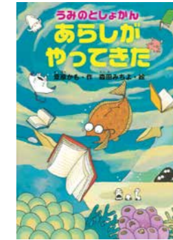
うみのとしょかん あらしがやってきた 葦原 かも／作 森田 みちよ／絵 講談社 (やさしいよみもの／069)

穏やかな海の中で図書館の管理をしているヒラメさん。ある日、大きな嵐がやってきて図書館は大混乱。ヒラメさんは、本を守るために奮闘します。嵐が去った後も海の仲間たちの得意なことを活かして、本の修理をしたり、嵐で行方不明になった本を作ったり……。みんなで協力して行動を起こす姿に、図書館と本への愛が伝わってきます。