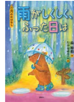
雨がしくしく、ふった日は6月のおはなし 森 絵都／作 たかお ゆうこ／絵 講談社 (やさしいよみもの／069)

クマのマーくんは、雨が降ると困ってしまいます。それは、雨の音が「しくしく、しくしく」と誰かが泣いているように聞こえるから。気分転換に運動をしてみても気になってしまい、お気に入りの傘をさして声の主を探しに出かけます。なぜ梅雨に雨が降るのか、その意味も学びながら、晴れやかな空気を感じることができるでしょう。