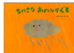
ちいさなあめふりぐも せなけいこ／作・絵 鈴木出版 (テーマ別絵本／016)

空に浮かぶ雨雲が、地上で遊ぶ猫たちと遊びたくて近づいてくる様子がとても可愛らしく描かれています。猫たちは、雨雲が自分たちと遊びたいと思っているとは思ってもせずに、近づく雲から逃げたり、退治しようとしていたりします。猫たちに水をかけられた雨雲が白くなって、雨雲は晴れ雲に変わります……。雨雲は、猫たちと友達になれるのでしょうか。