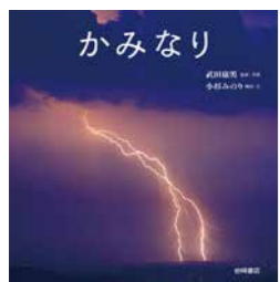
かみなり 武田 康男／監修・写真 小杉 みのり／構成・文 岩崎書店 (知識絵本／006)

かみなりは、どうやってうまれるのでしょうか。そもそも、かみなりとは何なのでしょう。たくさんの写真とわかりやすい文章で、かみなりの不思議について教えてくれる絵本です。かみなりの音がこわくて苦手な人も、この本を読んだら、かみなりの光がまるで生きもののように見えてくるかもしれません。