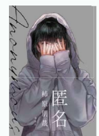
柿原 朋哉 // 著 講談社 (文学・文芸書/001)

街頭ビジョンから聴こえた覆面アーティスト「F」の歌声。その歌声に救われ、「F」の情報をSNSで集めることが生きがいとなった友香は、やがてある秘密を知ることになり……。『匿名の自由性』をテーマに、生きづらさや将来への不安など、現代を生きる若者が抱える問題が丁寧に描写されています。