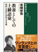
宮崎 哲弥 // 著 新潮社 (語学・参考書/013)

「もっと洗練された言葉で表現したい」「ボキャブラリーを増やしたい」と思ったことはありませんか？評論家として活躍し、学生の頃から語彙ノートを作ることが好きだったという著者が厳選した、集大成とも言える語彙集です。普段あまり見聞きしない言葉の意味や用法が端的に説明された本書は、語彙力向上の一助となることでしょう。