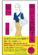
ユ・インギョン // 著 吉原 育子 // 訳 サンマーク出版 (ビジネス/205)

長年、新聞記者として活躍した著者が、自らの経験と知識から娘に語ったことをまとめた一冊です。社会の暗黙のルールや人間関係の割り切りなど、女性がイキイキと仕事をするためのヒントが、時に厳しく、時に優しく語られています。あなたも母親からアドバイスをもらうようなつもりで、手に取ってみてください。