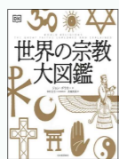
ジョン・ボウカー // 著 中村 圭志 // 日本語版 監修 黒輪 篤嗣 // 訳 河出書房新社 (人文/069)

本書は、死生観や哲学思想、生活文化にも影響を与えてきた宗教について、約550点の図版を用いて、様々な視点から解説されています。宗教の起源や信仰、習俗など、身近に存在する宗教について、ポピュラーなものからマイナーなものまで幅広く追及し、多文化への理解を深めることができます。宗教に興味を持つ方や、異文化交流に関心のある方におすすめの一冊です。